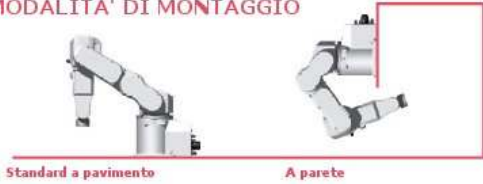
Standard a pavimento